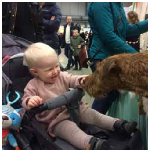
Barn gillar irländska terriers, irländska terriers gillar barn. Ömsesidig kärlek.