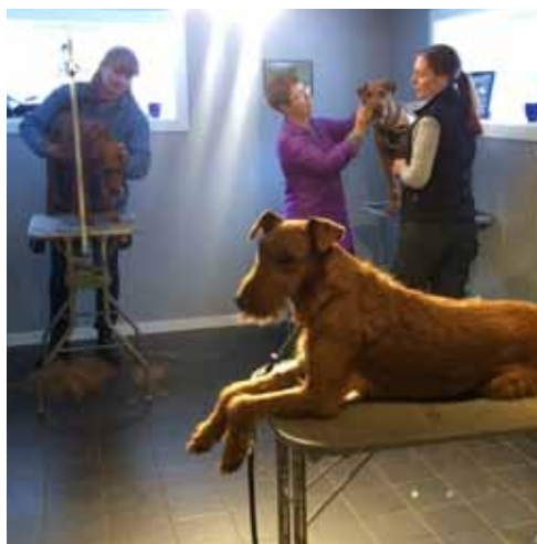
Fem energiska Trimmare i Tierp. Somliga chillar och funderar på när det är mat.