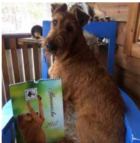
”Undrar om jag kan få bli kalenderflicka nästa år?”